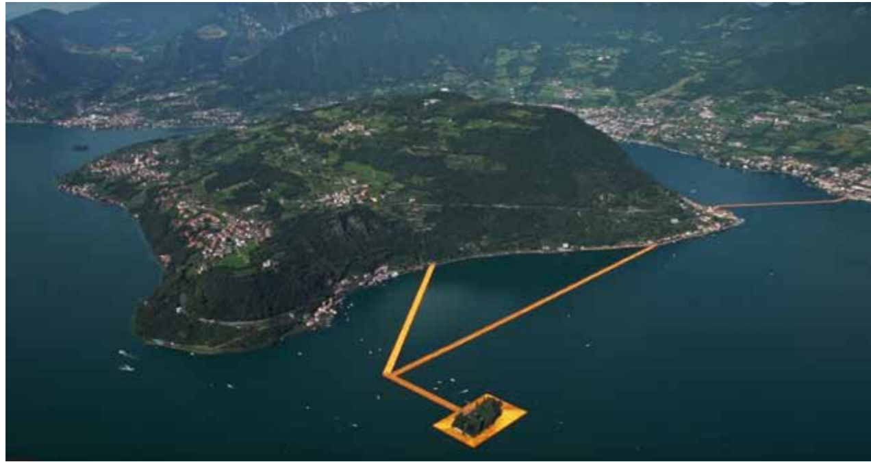
Alamode Film und Christo: Floating Piers 17.6.2016