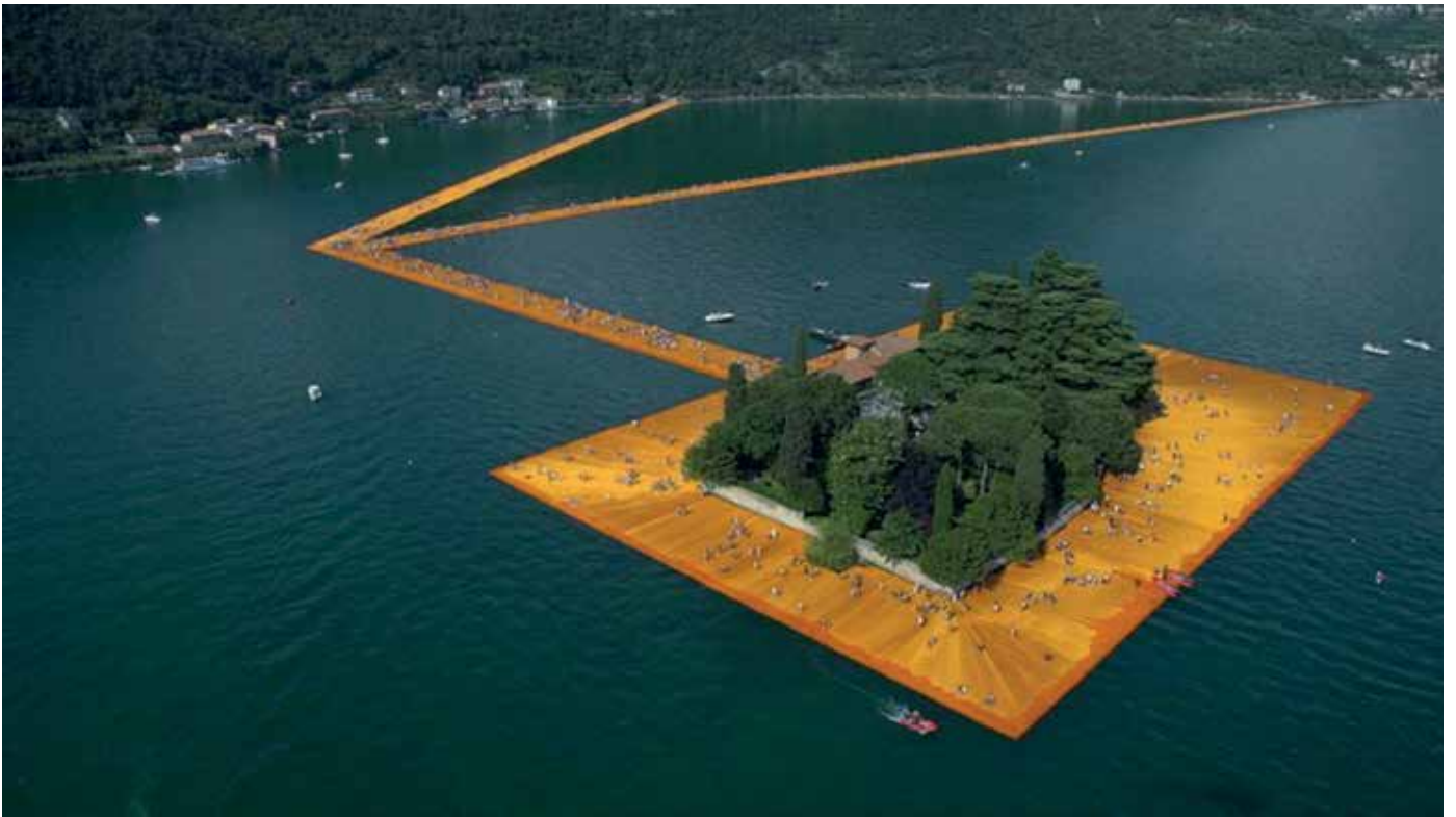
und Christo: Floating Piers 18.6.2016

AUF DEM WASSER GEHEN KÖNNEN. Eine realisierte Utopie (mit Menschen)