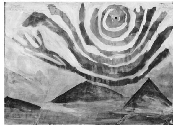
Von Föhnix zu FÖHNIX

sind der Auftakt für die Geschichte, die erzählt wird, Staffage für den Rahmen. Als die Idee der Geschichte, der Entwurf des Gegenbildes sich im Kopf des Autors materialisiert hatte, war es mit der Beschaulichkeit im Inneren des Sonntagmalers Achternbusch vorbei, er wurde Wertagsmaler (der freilich auch am Sonntag malen konnte), und der Sonntagsmaler wurde in die Föhnforscher integriert. FÖHNCHL ist zwar auch ein geschlossenes System, aber anders strukturiert. Das System ist – um die Metapher von oben wieder zu gebrauchen – ein Gebäude, an dem die Eingangstür zu fehlen scheint. Gelangt man, auf welchem Weg auch immer, in das Innere, muß man zwar ohne Licht auskommen, eine Orientierung ist aber trotzdem möglich.