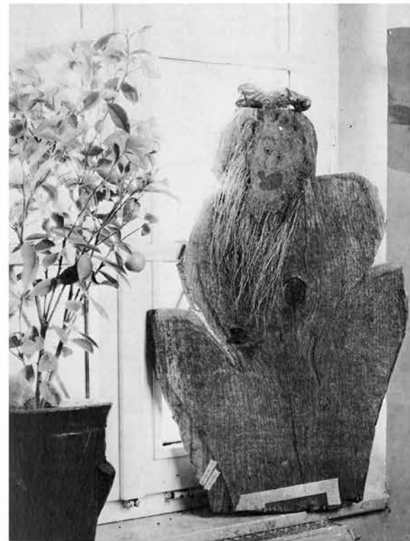
Laotse und ich (vor dem Licht)

121 Heinrich von Kleist, Über das Marionettentheater.