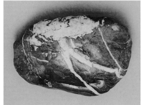
Aha, ein Zeitungsleser! 15

Motive können auch schon nach kurzer Zeit zu einem mythischen Urgestein verfestigt sein. Die Würstelbude soll z.B. erstmals als Begriff im Zusammenhang mit Peymann gefallen sein, der von Bo-