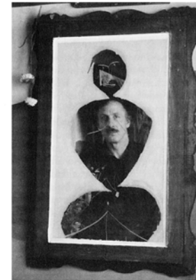
Selbstbildnis für Hannes Jähn (zerstört)

den Gedanken des Gegen-Bilds empor, bei dem ein zum Teil collagierter und bemalter Spiegel, durch einen mächtigen Rahmen als »Bild« gekennzeichnet, den Betrachter immer mit dem neuesten Stand seines Spiegelbilds konfrontiert. Aus den Text- und Bildzitate lassen sich Ich-Projektionen ableiten, die einerseits einen Narziß-, andererseits einen Proteus-Typus hervorkehren. 61 Das Beharren auf der Leidensgeste, bzw. das Unterstreichen der Ausgelassenheitsgebärde in seiner Selbstbespiegelung und das Verstecken hinter vielfältigen Masken bilden mit ihrer manisch-verzweifelten Suche nach Identität einen Grundzug im Ausdruckskanon Achternbuschs.