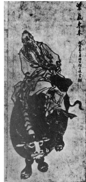
Laotse und Büffel

( Der Ochse und sein Hirt ). Aneignungen finden bei der Beschäftigung mit dem fernöstlichen Stoff statt, meistens wohl unbewußt. Der Büffel unter einem reitenden Laotse z.B. – Laotse soll der Legende nach im Alter auf einem Büffel gen Westen geritten sein, ohne je zurückzukehren – taucht in dem oben schon mehrfach erwähnten Büffel der Springtime -Serie wieder auf, der Esel bezeichnet wird. 114 In jedem Werk der jüngsten Zeit ist irgendwo ein Hinweis auf buddhistisches Gedankengut versteckt, vom Verschwinden eines Föhnforschers im Abendrot »wie ein arrivierter Buddha« 115 oder dem defätistischen Maler in Missing Link 116 bis hin zur verkürzten Wanderung Kultusministerium – Nirvana in Punch Drunk .